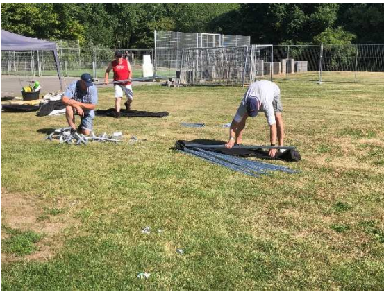
Ieder jaar weer een opgaf: de slaaptent opbouwen. Uiteindelijk komt het goed.

Ieder jaar is het weer verbazingwekkend om te zien hoe in enkele dagen vanaf niets, behalve het aanwezige gras, een compleet JOL-dorp ontstaat. En dat in een buitentemperatuur van meer dan 30° Celcius. Rondom ons terrein een veilige omheining (zowel voor de kinderen als voor ons). Een ruime slaaptent met daarbij gezellige partytenten voorzien van ledverlichting. Vanuit de gymzaal komen elektra- en wateraansluitingen richting onze kookwagen. Extra elektriciteit komt van onze vriendelijke overbuurman Jan. Zie hier hoe dat in z'n werk gaat.