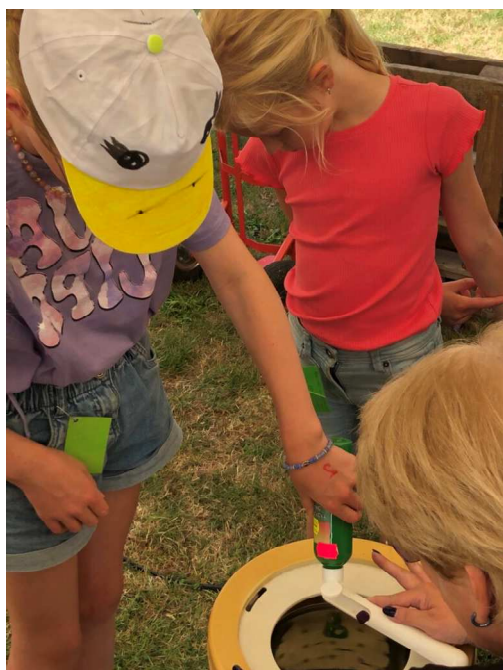
We vervolgen ons programma met het maken van een persoonlijk werkstuk met plakkaatverf in een oude centrifuge. Papier even laten drogen aan een waslijntje en klaar om mee naar huis te nemen.