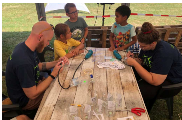
De laatste kinderen voltooien het graveren van hun glas. En tot slot krijgen alle kinderen (en een aantal ouders en alle leiding) heerlijke ijsjes.